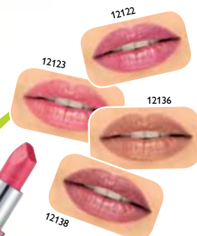
Одна из губных помад «Притяжение цвета» №12