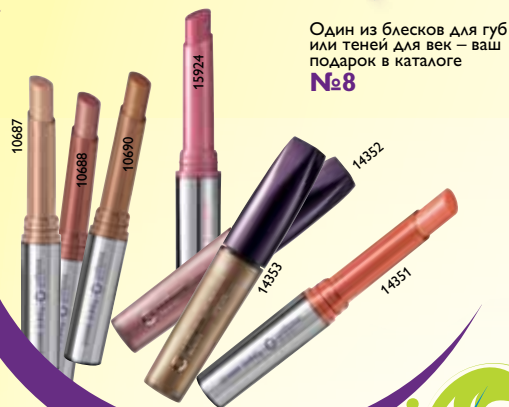
Один из блесков для губ или теней для век – ваш подарок в каталоге №8