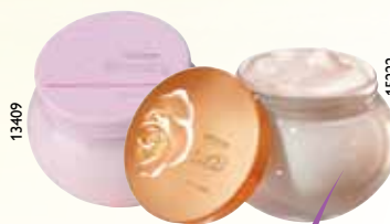
Один из кремов для тела – ваш подарок в каталоге №11