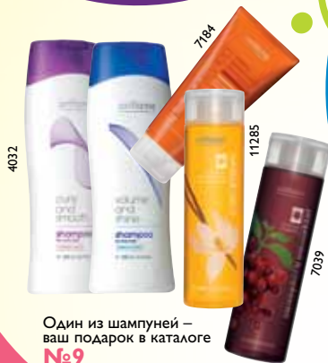
Один из шампуней – ваш подарок в каталоге №9