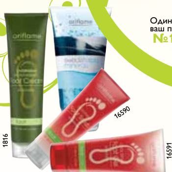
Одно из средств по уходу за ногами или телом – ваш подарок в каталоге №10

Для участников ЛК**! Получите набор сумок для путешествий